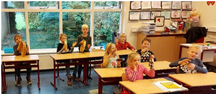
Maar de muzieklessen in de groep bij de juf gaan gelukkig wel door.

En weer zijn de Corona-maatregelen aangescherpt. Geheel terecht natuurlijk, het aantal besmettingen loopt te snel op. Het betekent voor ons wel dat de gymdocent, de muziekdocenten en de drama- en dansdocenten niet bij ons op school mogen komen. We houden ons strikt aan de maatregelen. We moeten er niet aan denken dat de scholen weer dicht gaan.